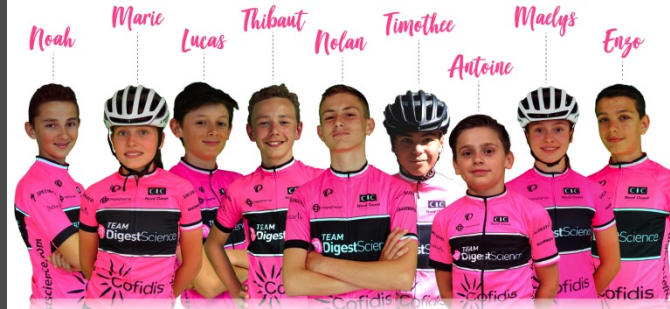
Les p'tits ambassadeurs DigestScience

Pour la 5 ème année consécutive, les P'tits Ambassadeurs DigestScience sont partis sur les routes du « Tour de France » pour vaincre la maladie de Crohn