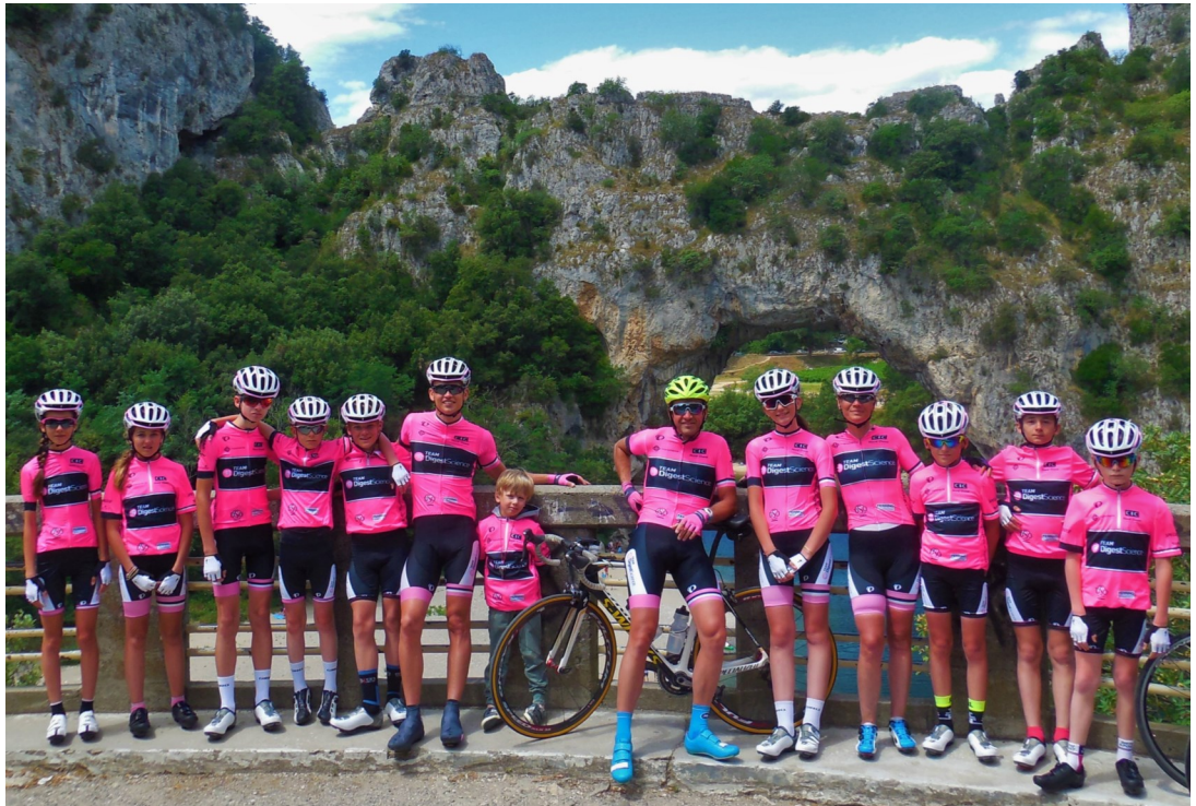
Sur la photo, les p'tits ambassadeurs 2016 à Vallon Pont d'Arc

La sélection des jeunes a été effectuée en collaboration entre des services de gastro-entérologie de plusieurs centres hospitaliers et la fédération française de cyclisme des Hauts-de-France afin de créer l'équipe des P'tits Ambassadeurs DigestScience.